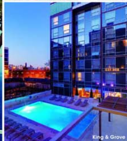
King & Grove